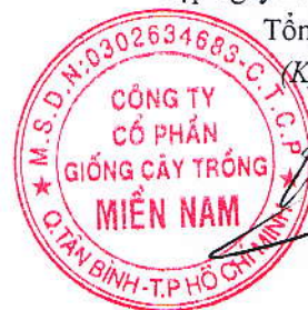
Hàng Phi Quang