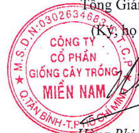
Hàng Phi Quang